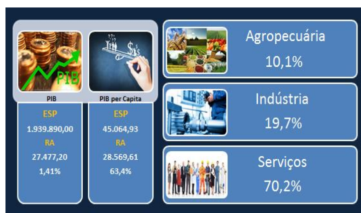
PIB / PIB per Capita / Valor Adicionado

A região é conhecida como grande produtora agrícola. Nos últimos anos, houve a renovação da cultura do café, mediante novas técnicas e melhor aproveitamento do solo, e o estímulo à produção de cana-de-açúcar. São importantes, ainda, a mandioca, o milho, o trigo, o amendoim, a soja, a fruticultura e a seringa, além da pecuária, avicultura e criação de bicho-da-seda (sericicultura).